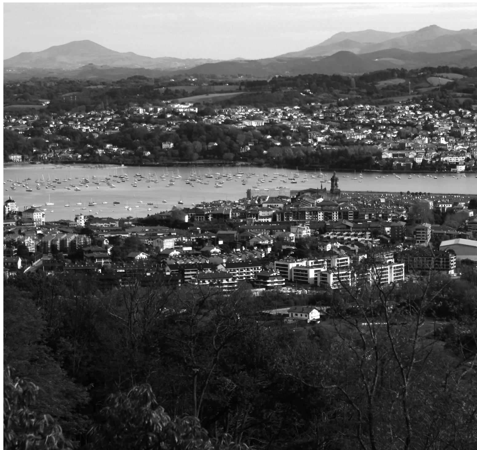
Hondarribiko argazki orokorra.

Azken urteetan, HAPO edo Hiri Antolamendurako Plan Orokorra kontzeptua makina bat alditan entzun behar izan dugu Hondarribian. 2017ko Planaren baliogabetzea, Arau Subsidiarioen berrindartzean sartzea eta HAPO berriaren izapidetzea martxan jartzea bizi izan dugu udaletxean gaudenetik. Eta garbi esan genezake, EAJ-PNVren herentzia, kasu honetan ere, ez dela kudeaketa onaren eredu izan.